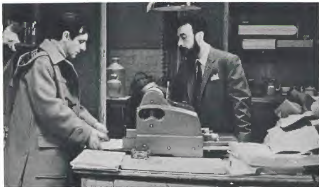
Emilio Gutiérrez Caba – José Luis Garcí